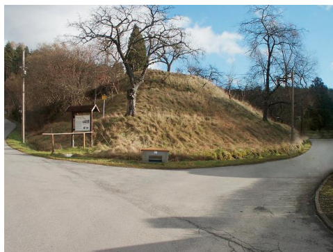
Halde der Steinkohlengrube Sophie im Ortsteil Buch von Neuhaus-Schierschnitz.