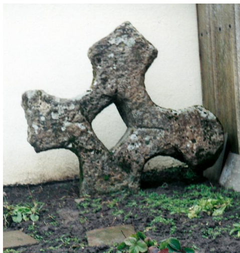
Steinkreuz am westlichen Ortsrand von Backleben.