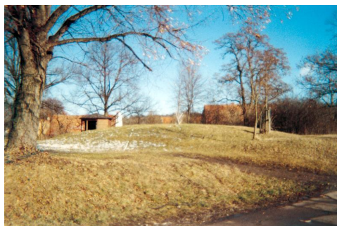
Die Hallonge, ein jungsteinzeitlicher Grabhügel.