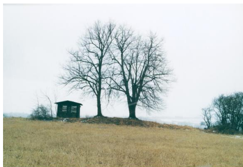
Der Grabhügel von Collis mit der Schutzhütte. Rechteinhaber: TLDA Weimar