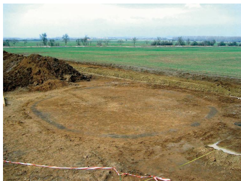
Kreisgraben des Hügelgrabes, heute Rand des Parkplatzes bei IKEA. 06_39 Abb2: IKEA-Grabung, Urne bei der Freilegung.