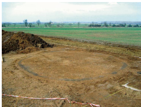
Kreisgraben des Hügelgrabes, heute Rand des Parkplatzes bei IKEA. 06_39 Abb2: IKEA-Grabung, Urne bei der Freilegung.