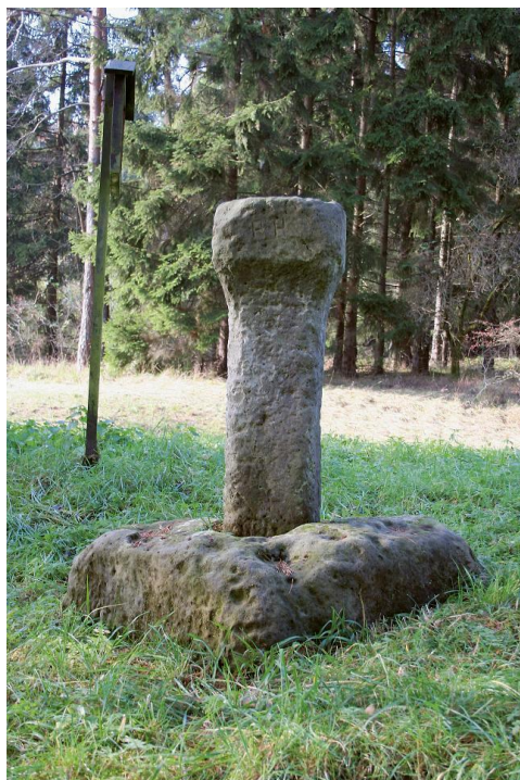
Die Docke von Bachfeld.