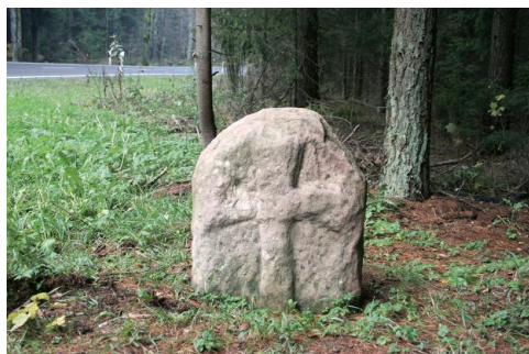
Der Kreuzstein von Bachfeld.