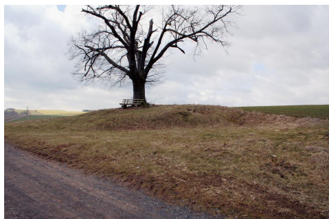
Der Grabhügel „Becks Grab“ auf dem Weg von Berka/ Werra nach Dippach.