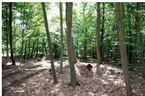
Überreste des Duckelbergbaus im Rathsfeld.