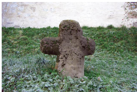
Die Nordseite des Steinkreuzes.