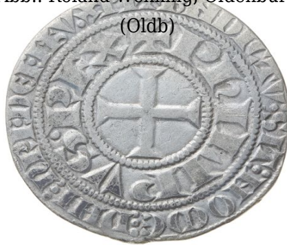
Abb.: Roland Wehking, Oldenburg (Oldb)