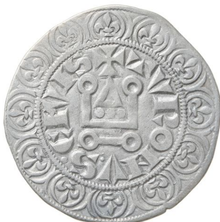
Abb.: Roland Wehking, Oldenburg (Oldb) Namensnennung - Nicht-kommerziell - Keine Bearbeitung 4.0 Deutschland (CC BY-NC-ND 4.0 DE) Rechteinhaber: Museum für Ur- und Frühgeschichte Thüringens