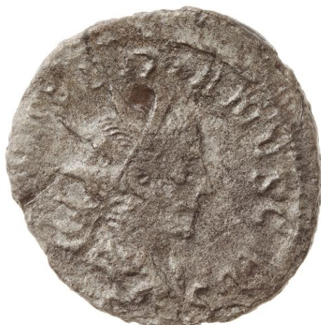
Abb.: Roland Wehking, Oldenburg (Oldb) Namensnennung - Nicht-kommerziell - Keine Bearbeitung 4.0 Deutschland (CC BY-NC-ND 4.0 DE) Rechteinhaber: Museum für Ur- und Frühgeschichte Thüringens