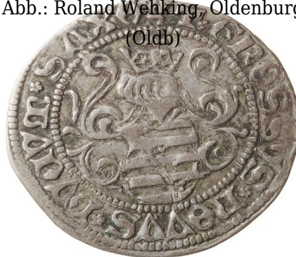
Abb.: Roland Wehking, Oldenburg (Oldb)